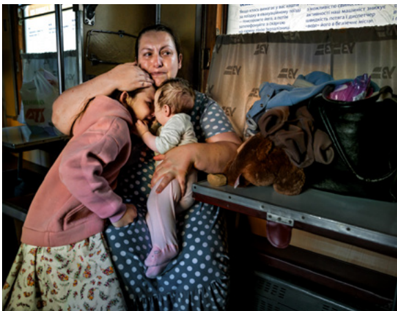
Bilder från fotoutställningen "Internationella RSF 40 år".