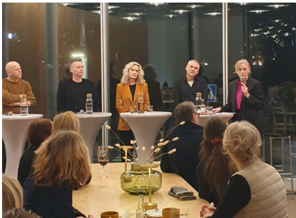
Panelsamtal Bonnier huset.